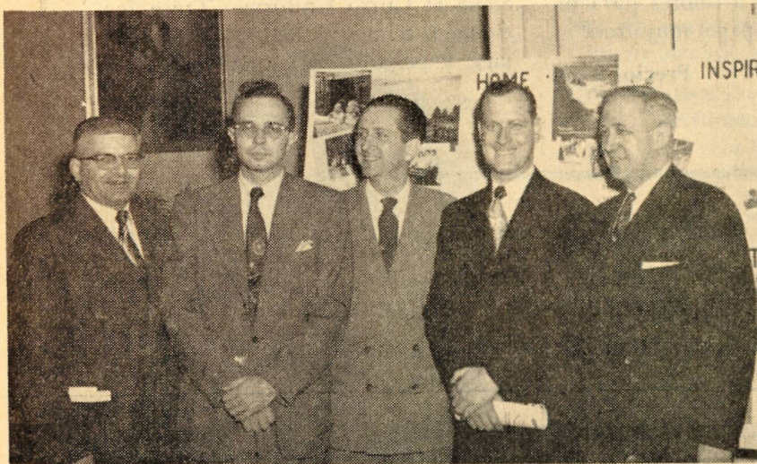
He aquí una fotografía tomada durante la V Convención Anual de la Asociación de Prensa Evangélica que se reunió en la ciudad de Chicago.